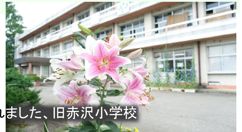
今年も綺麗に咲いてくれました、旧赤沢小学校

◆「コンピュータで 人を育てる 」ことを目的として、コンピューファームというネーミングにこめられています。